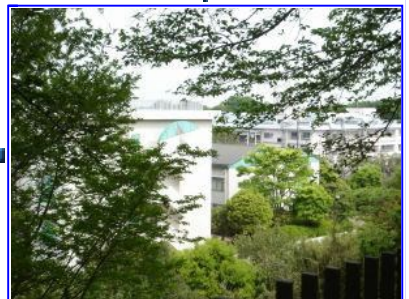
左手に野津田高等学校が見えてきます。