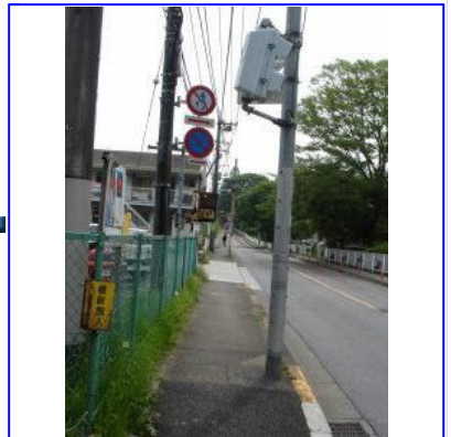
小野神社を右手に見ながらひたすら直進します。