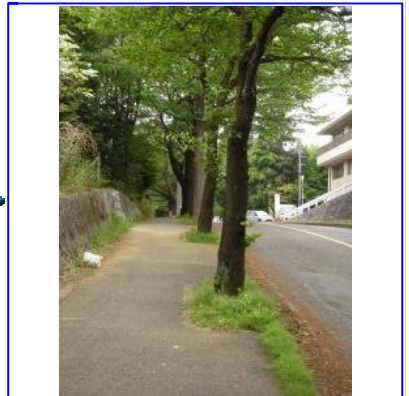
「南多摩整形外科」「日本聾話学校」を右手に見ながら桜並木の坂(桜坂)を登って行きます。