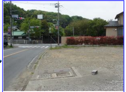
バスが来た方を振り返り、「小野神社前」の交差点を左に曲がります。