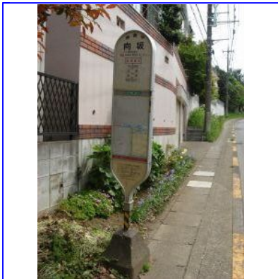
「向坂」バス停も通り過ぎて直進します。