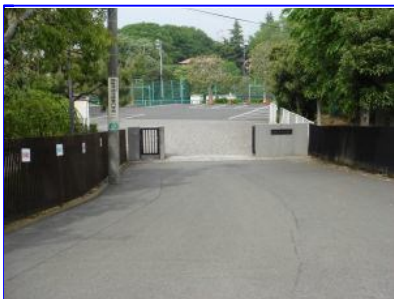
ロータリーの左側が野津田高等学校の正門です。