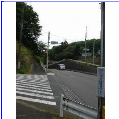
「野津田高校入口」の交差点を左に曲がります。