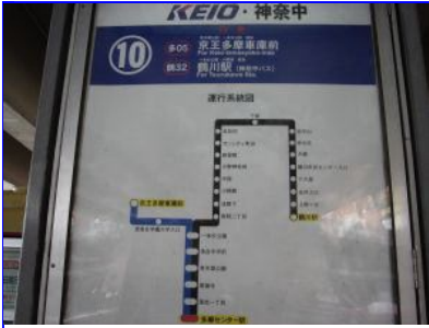
多摩センター駅バスターミナル10番のりばです。鶴川駅行に乗車し、10番目の「小野神社前」で下車。1時間に1本くらいですのでお気をつけください。