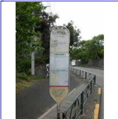
「野津田高校入口」バス停も通り過ぎて直進します。